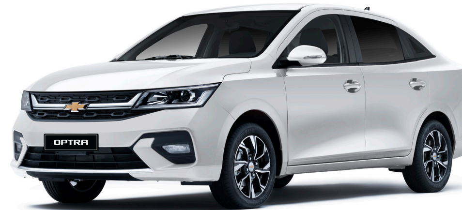
Casablanca White ● أبيض