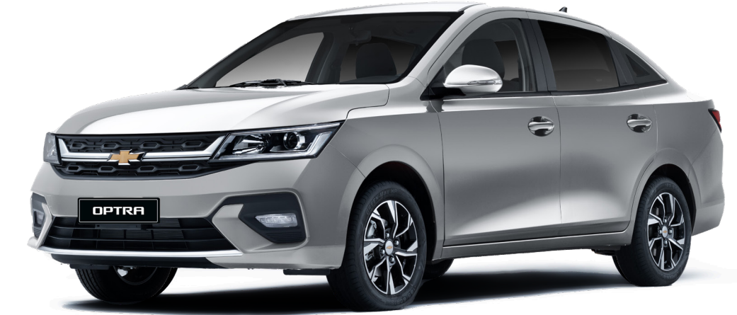
Poly Silver ● فضي