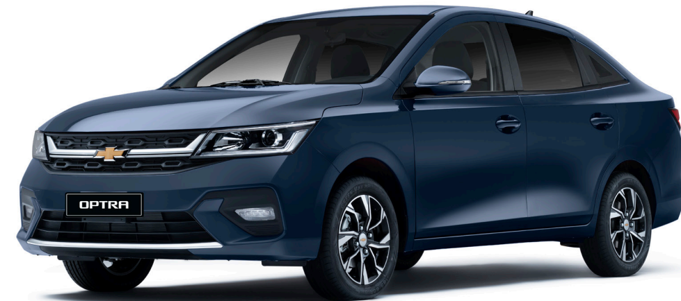
Persian Blue ● أزرق