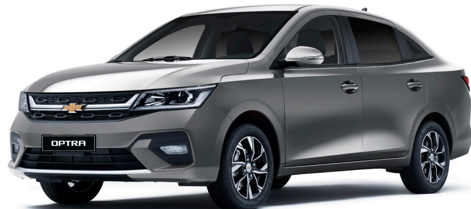
Urban Gray ● رمادي فاتح