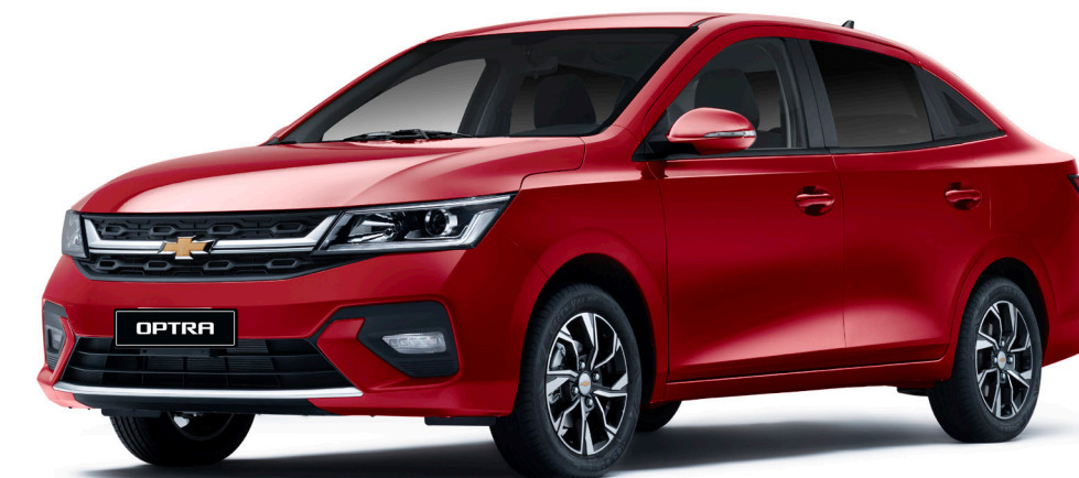
Flame Red ● أحمر