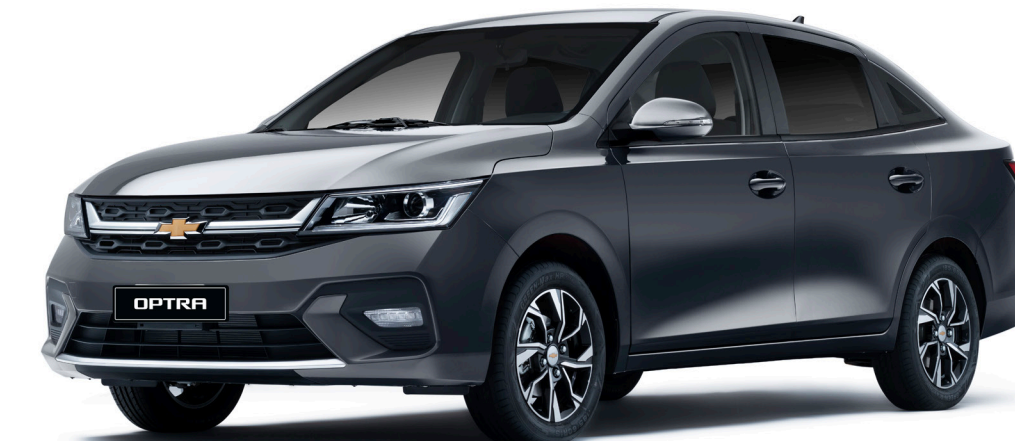
Dark Denim Gray ● رمادي غامق