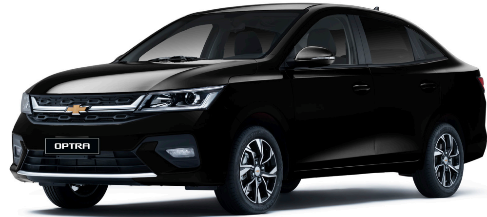
Pearl Black ● أسود