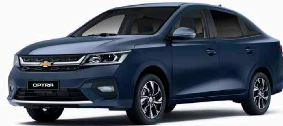
Persian Blue ● أزرق