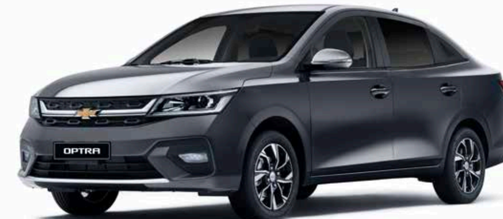
Dark Denim Gray ● رمادي غامق