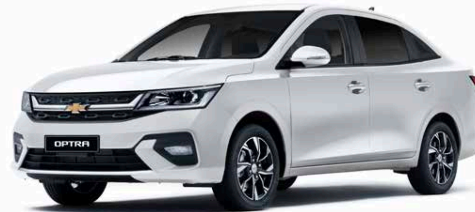
Casablanca White ● أبيض