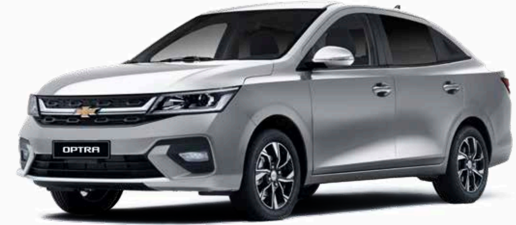
Poly Silver ● فضي