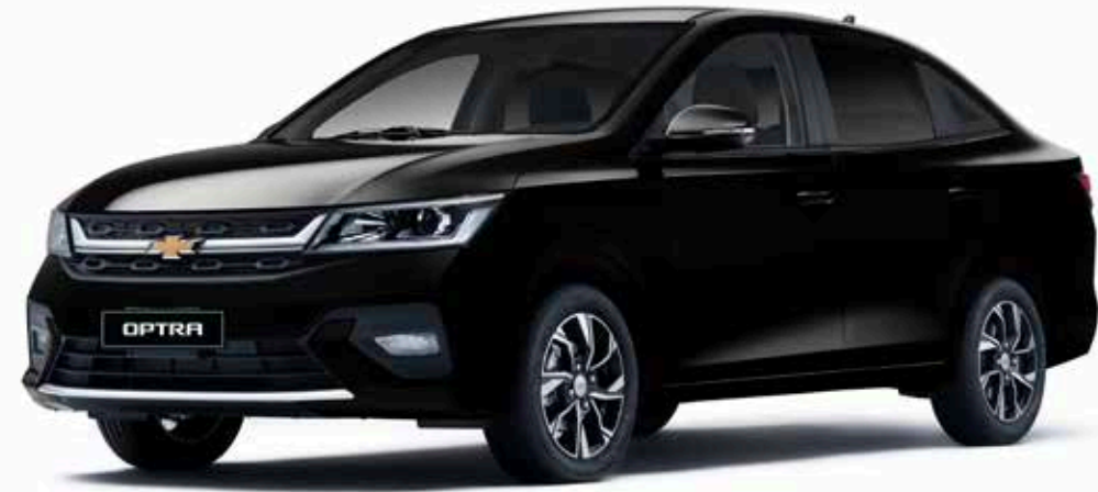
Pearl Black ● أسود