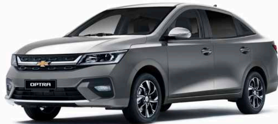
Urban Gray ● رمادي فاتح