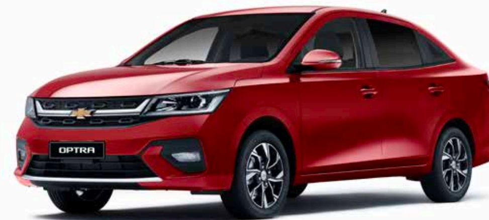
Flame Red ● أحمر